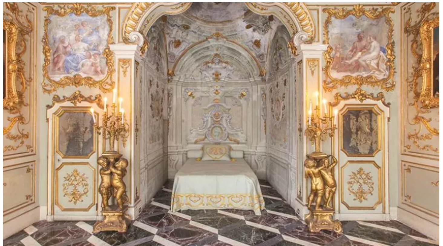
▲ Palazzo Rosso